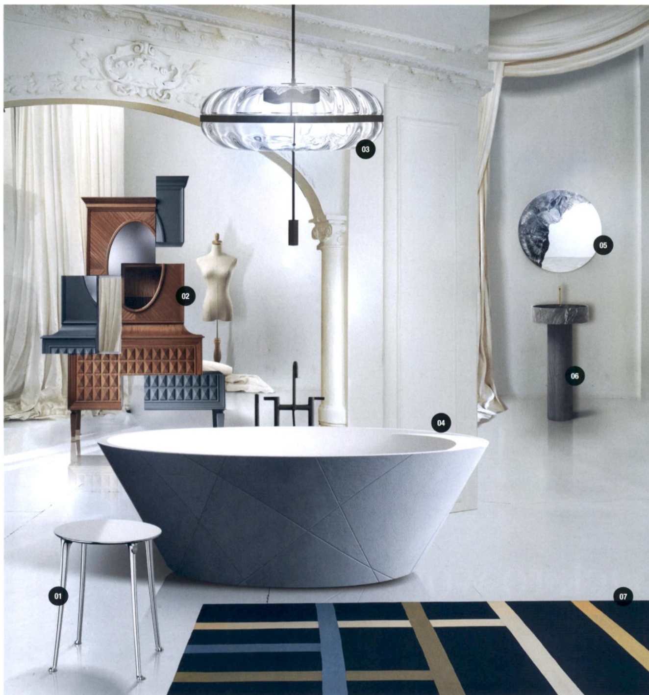
01 DIOR BY STARCK. Sgabello in alluminio ludico. Design Philippe Starck; 02 FRATELLI BOFFI. D/Vision.2, trumeau in legno con elementi a specchio; 03 GALLOTTI&RADICE. Jolie, sospensione in vetro soffiato e metallo; 04 ACQUABELLA. Opal quiz, vasca da bagno freestanding in Akron, materiale composto da poliuretano e minerali; 05 FERNANDO MASTRANGELO. Coast (Big sur), specchio con decoro realizzato a sabbia; 06 NOVELLO. Frai, lavabo freestanding con base in legno e vasca in composto di resina; 07 HERMÈS. Cordélie oxer, tappeto in cotone. Design Pierre Charpin